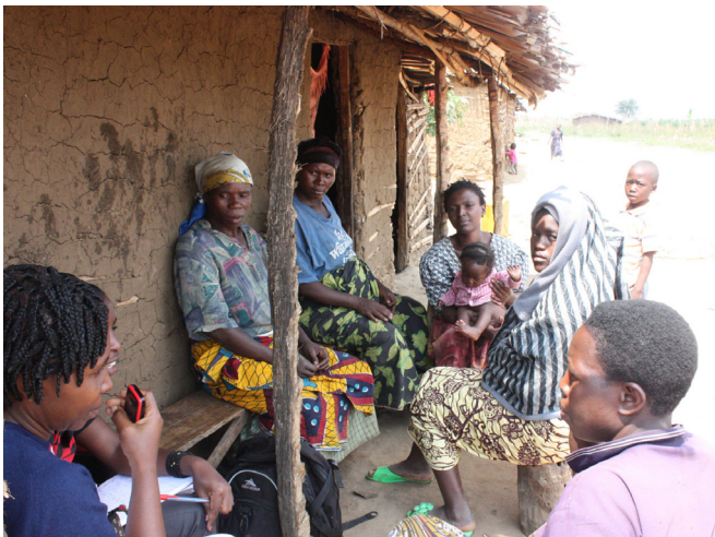
Wanawake katika jumuiia wamekusanyika katika mfjadala wa kikundi.

Mwanachama moja wa Tume ya Wanawake ya Wakimbizi alizuru Nakivale kwa wiki saba kati ya Juni na Julai 2011. Yeye na timu yake ya wanachama 6 waliwahoji wanawake 540 wenye miaka ya uwezo wa kuzaa (miaka 15-49). Pia walikutana na wanaume 48, wanawake, na wasichana na wawulana waliobalehe katika majadiliano ya kundi, na kuwahoji viongozi wakimbizi wa jumuiia ili kujifunza kuhusu mawazo yao kuhusu upangaji uzazi. Pia walizuru vituo